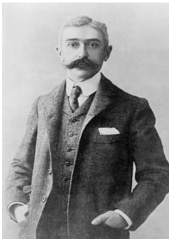
Charles Pierre Frey de Coubertin

Le site d'Olympie était dédié à Zeus. Pour honorer ce dieu, Olympie accueillait [...] les jeux olympiques durant l'Antiquité. Aujourd'hui encore, la flamme olympique y est allumée quelques mois avant la cérémonie d'ouverture des jeux olympiques modernes.